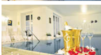
Bsp. DZ Komfort (gegen Aufpreis)