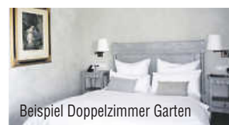
Beispiel Doppelzimmer Garten