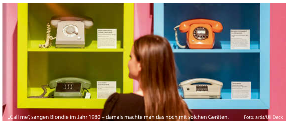
„Call me“, sangen Blondie im Jahr 1980 – damals machte man das noch mit solchen Geräten.

Heinz Rudolf Kunze stellte seine Gitarre bereit, Thomas Anders von Modern Talking den Bravo-Otto, Steffi Graf ihre Goldmedaille von Seoul. Und im November folgt ein weiteres Highlight: Udo Lindbergs legendäre Gitarre mit der Aufschrift „Gitarren statt Knarren“, die der Sänger 1983 Erich Honecker überreichte, findet dann ihren Weg nach Karlsruhe. Grund genug, sich einmal auf Zeitreise zu begeben, oder? (jr/tam)