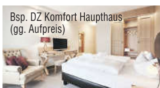
Bsp. DZ Komfort Haupthaus (gg. Aufpreis)