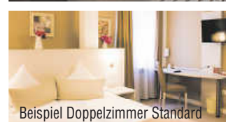
Beispiel Doppelzimmer Standard